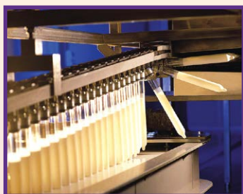
Linha de imersão automatizada para conformidade com as normas

Sem sabor, banana, morango, framboesa, laranja, durian, pêsego, orvalho do mel, abacaxi, maçã verde, uva, cereja, limão, maracujá, tutti frutti, hortelã-pimenta, café, chocolate, baunilha