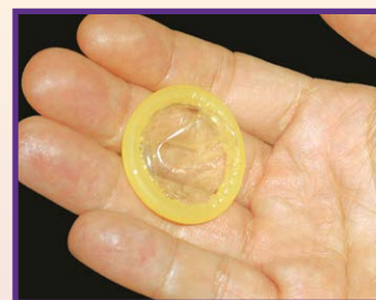
Preservativos que oferecem segurança, desempenho e prazer