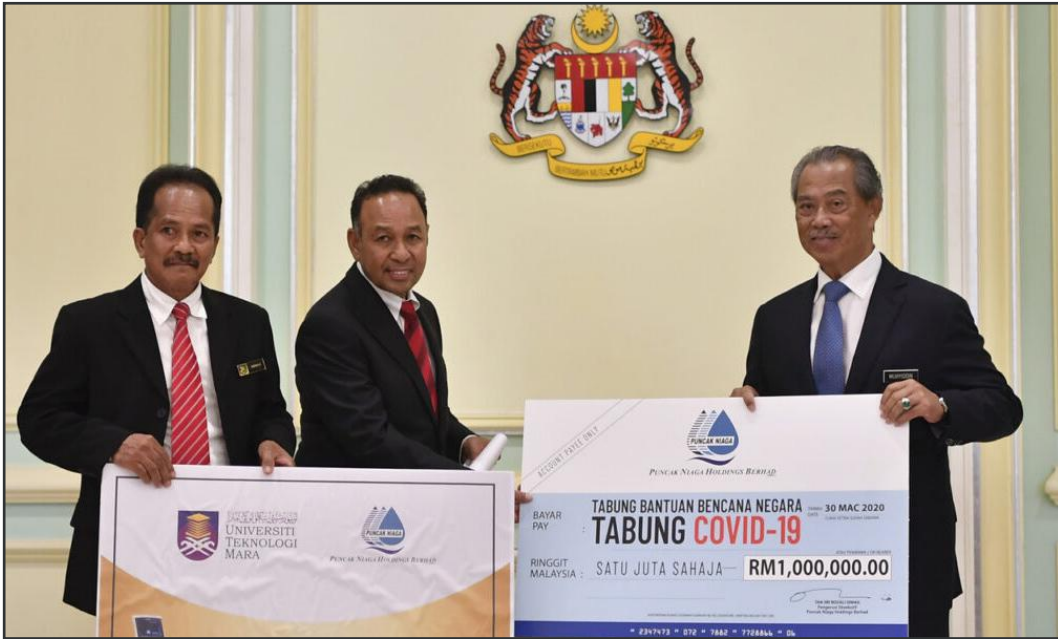
Tan Sri Muhyiddin Yassin menerima sumbangan wang dan peralatan perubatan daripada rakan-rakan korporat untuk Dana COVID-19