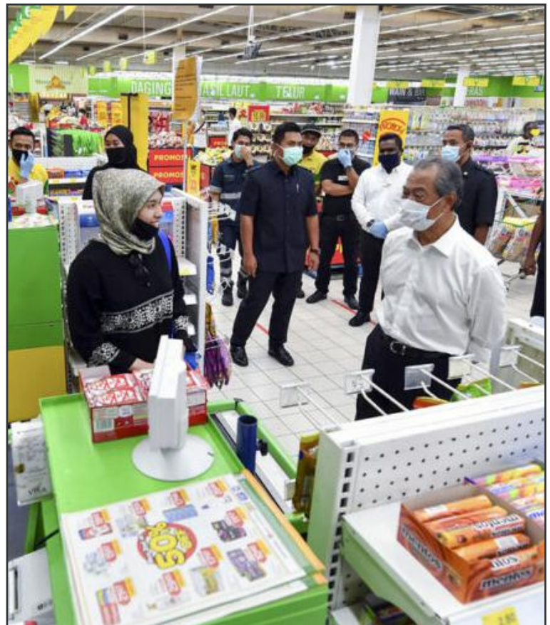
Tan Sri Muhyiddin Yassin meninjau aktiviti runcit di pasar raya besar di Seri Kembangan berikutan pelaksanaan Kawalan Pergerakan