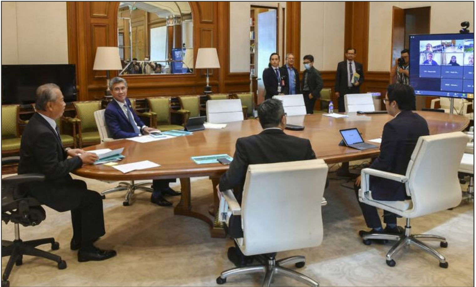
Muhyiddin dan Menteri Kewangan Tengku Datuk Seri Zafrul Tengku Aziz mengadakan persidangan video dengan enam ketua GLC di pejabatnya di Perdana Putra