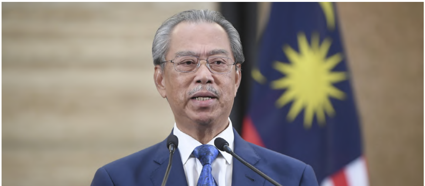
Tan Sri Muhyiddin Yassin mengumumkan Pakej Rangsangan Ekonomi Prihatin Rakyat (PRIHATIN) pada 27 Mac 2020 yang lalu

7. Bayaran 'one-off' kepada pemandu teksi sebanyak RM600.