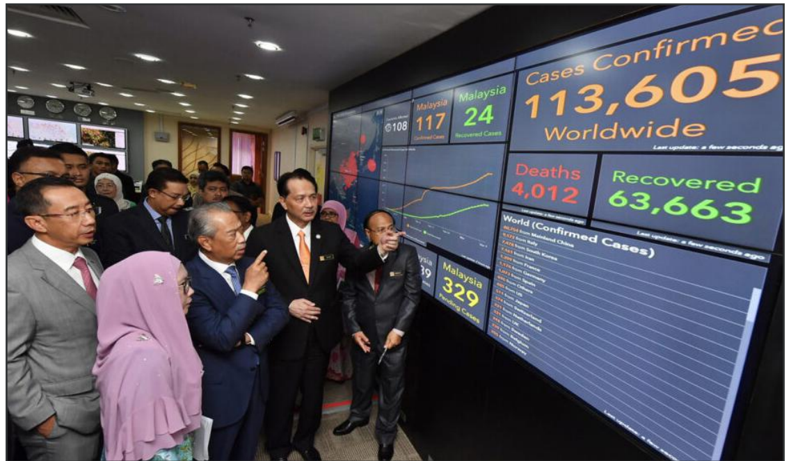
Tan Sri Muhyiddin Yassin melawat Pusat Kesiediaan dan Tindak Balas Krisis Kebangsaan (CPRC) di Kementerian Kesihatan (KKM)