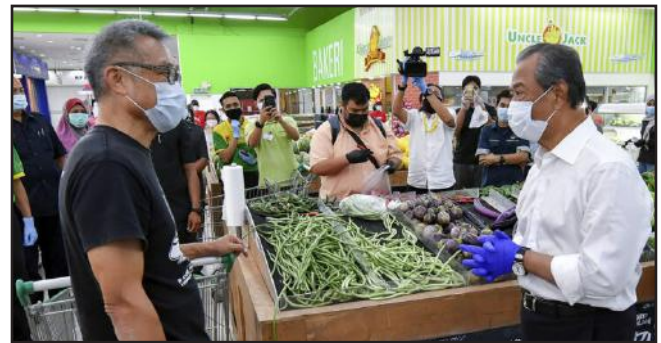
Tan Sri Muhyiddin Yassin melakukan tinjauan aktiviti jualan dan pembelian di sebuah pasar raya besar di Seri Kembangan.

Peruntukan berjumlah RM130 juta juga akan disalurkan kepada negeri-negeri untuk membantu kerajaan negeri menangani krisis COVID-19.