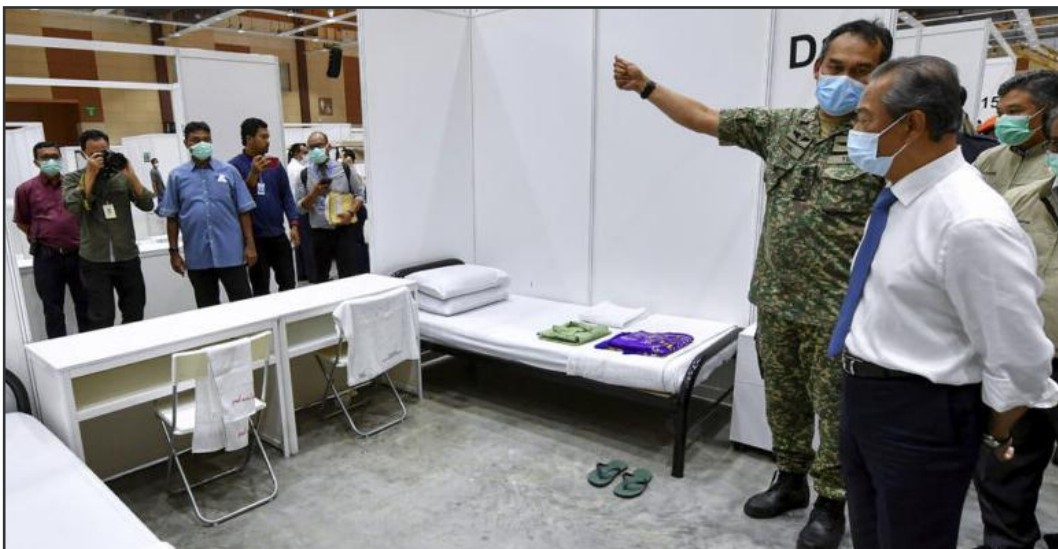
Tan Sri Muhyiddin Yassin melawat Pusat Kuarantin dan Rawatan untuk pesakit COVID-19 yang berisiko rendah di Taman Ekspedisi Agro Malaysia, Serdang (MAEPS)